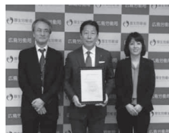
株式会社イズミ 様(3段階)