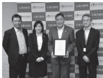
西川ゴム工業株式会社 様(3段階)