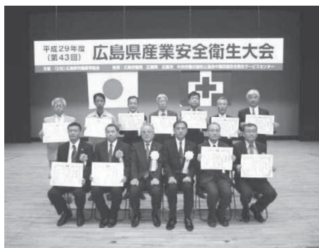
会長表彰を受賞された皆様