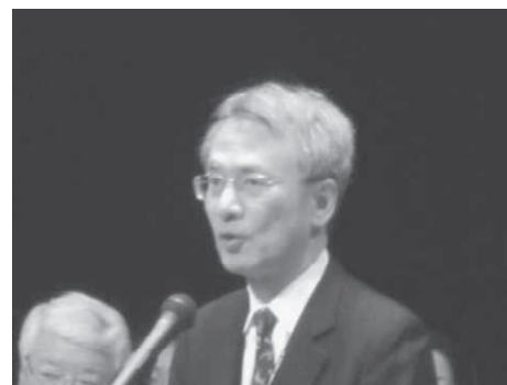
祝辞 川口 達三 広島労働局長

また、本年も会場内に職場の安全・衛生・快適を実現するための関連機器の「展示コーナー」、職場の安全衛生の「相談コーナー」、体力測定のための「体験コーナー」を設け多くの方にご利用いただきました。